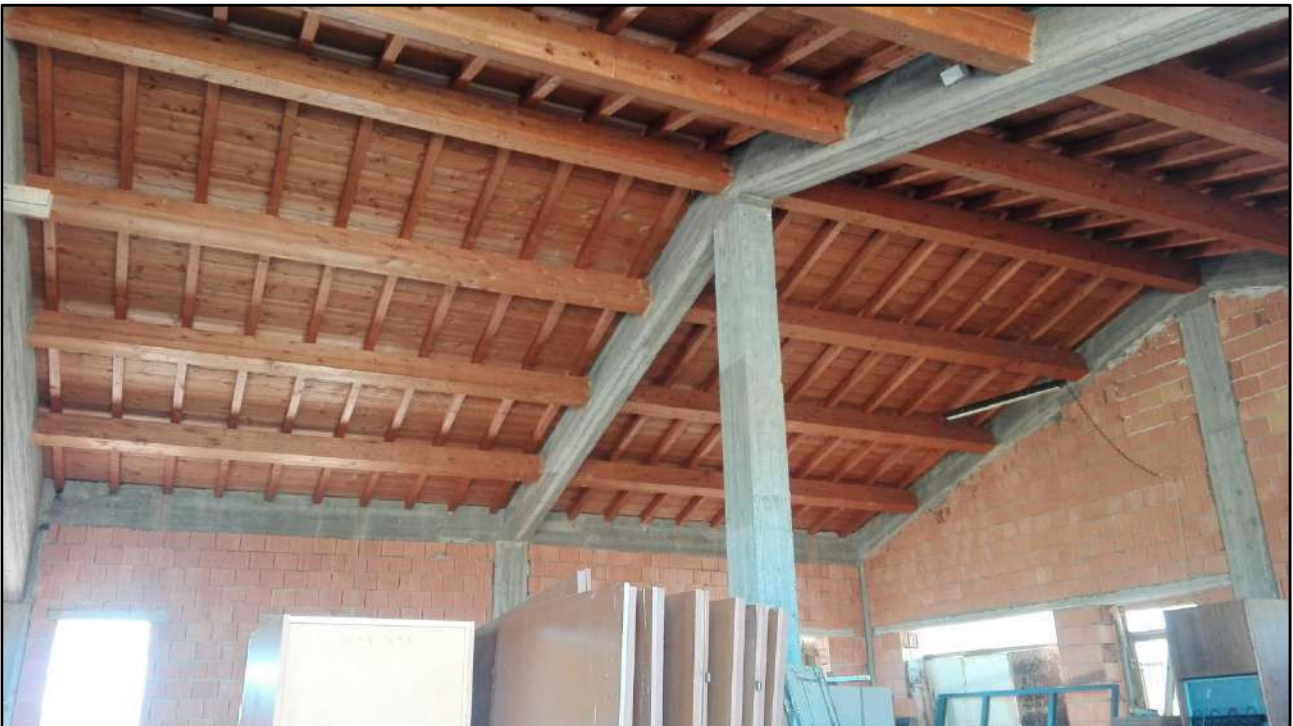
Foto: 11 (Particolare della copertura del fabbricato in legno lamellare)