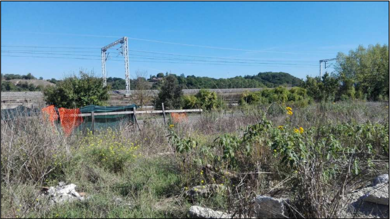
Foto: 24 (Dettaglio terreno antistante il fabbricato in costruzione)