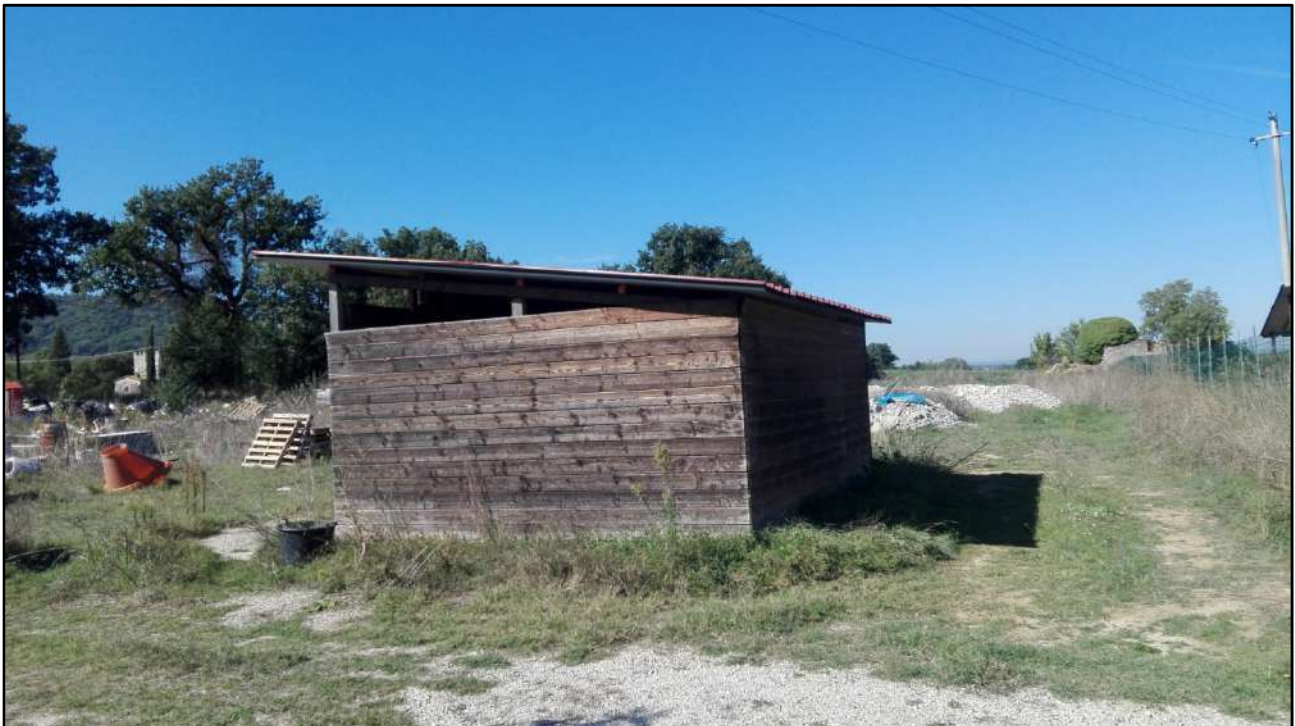
Foto: 15 (Baracca abusiva in legno sul terreno oggetto di pignoramento)