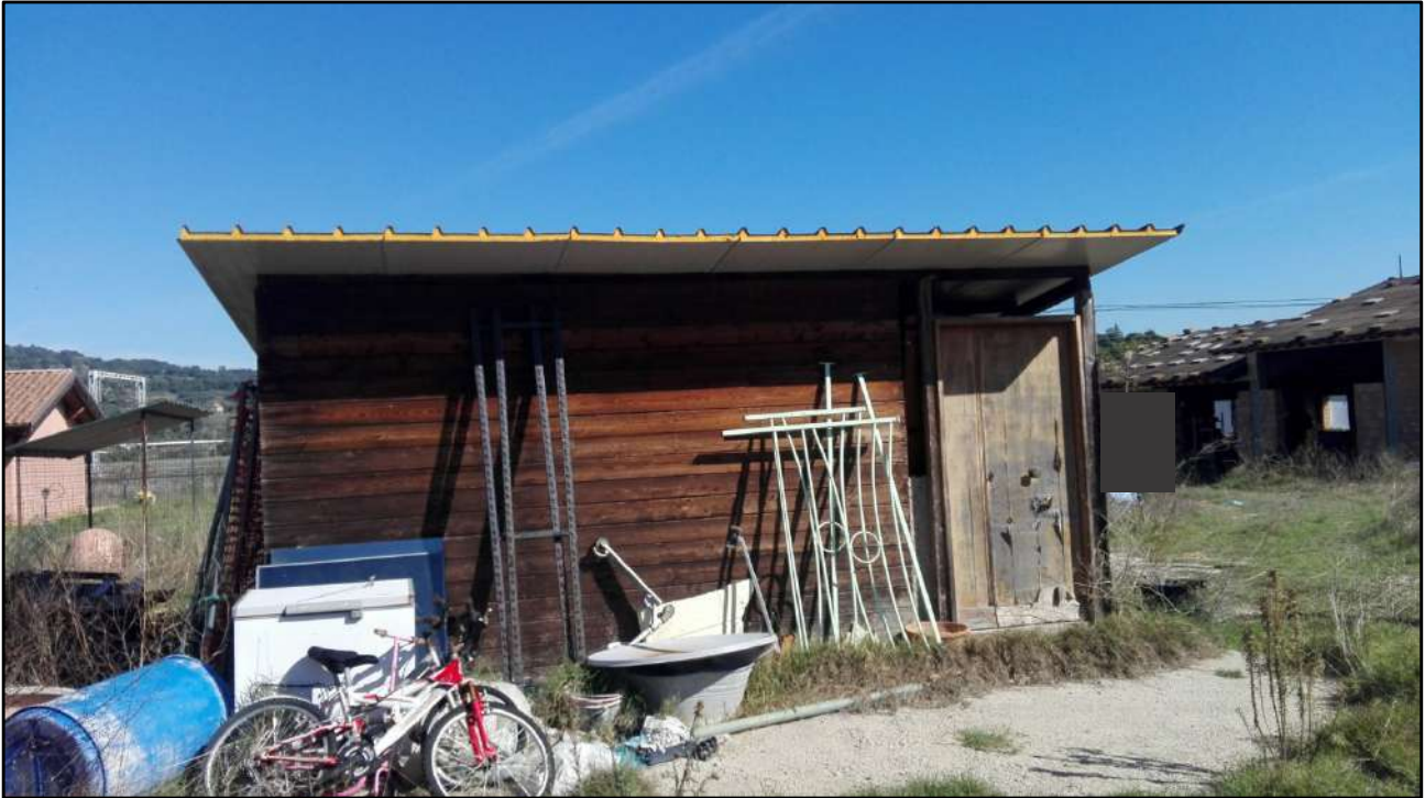
Foto: 16 (Baracca in legno abusiva sul terreno oggetto di pignoramento)